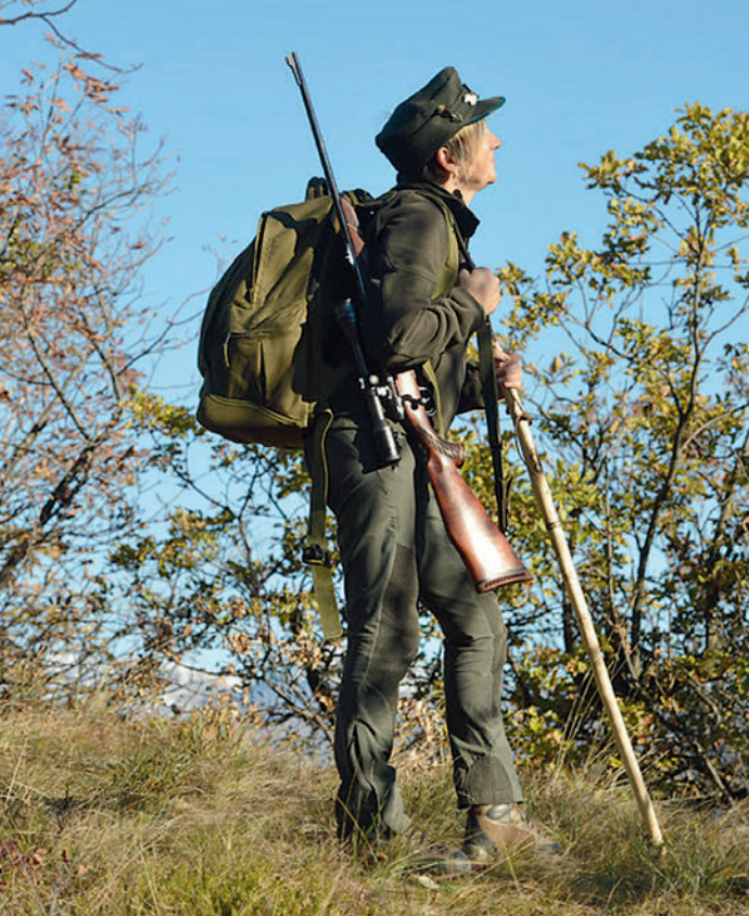
◀ Porto "normale"

tivo ed in apposita custodia chiusa. In sostanza, se in un determinato luogo o in un determinato tempo non si può cacciare... non si potrà nemmeno portare un'arma, mentre la si potrà solo trasportare.