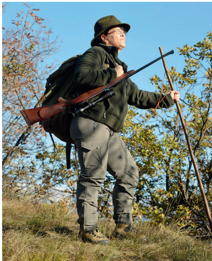
Porto "alla tedesca" ➤

Trasportare un'arma, portare un'arma: una differenza fondamentale